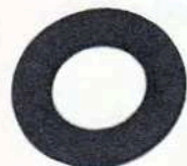
3492 Rondella in fibra per raccordo benzina (rif. orig. 7663.40)