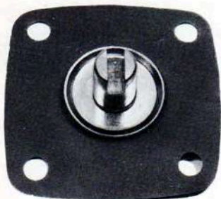
3487 Membrana pompa (h 10,5 \phi 19)