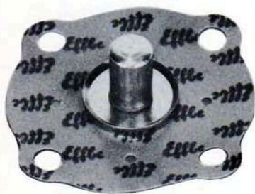
3224 Membrana pompa (h 12,8 φ 22)

A.R. Giulietta 1600 U.T. A.R. Alfetta 1,8 Berlina A.R. Alfetta 2000