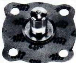
3196 Membrana pompa (h 12,8 \phi 26)