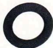
3233 Rondella in fibra per raccordo benzina (rif. orig. 7662.40)